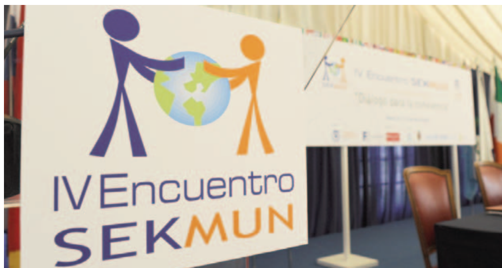
IV Encuentro SEKMUN.

Las Delegaciones estarán integradas por dos delegados en cada uno de los siguientes Comités: Asamblea General, Consejo de Seguridad, Ecosoc, Junta Ejecutiva de Unicef, Consejo de Derechos Humanos y Consejo Ejecutivo de UNESCO.